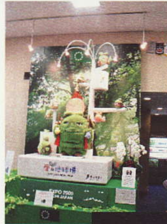
ロータリー館玄関口で モリソウのお出迎え (音楽にあわせてモリソウが 動きます。)