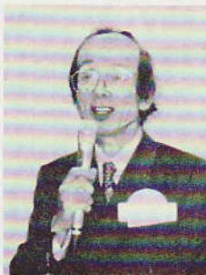
由井特別代表祝辞